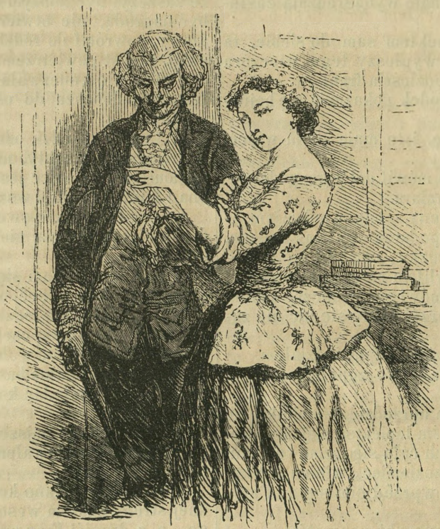
Powtórzyła mi to trzy razy. . . .

Pokój wam, jeżeli tylko znaleźć go możecie. Ale zdaje mi się, że nawet samo niebo, gdyby się do niego z takim usposobieniem wewnętrznym dostać było można, nie potrafiłoby wlać spokoju w ich dusze. Napróżnoby wszystkie duchy niebieskie, na skrzydłach miłości kunim podleciały, by radośnie powitać przybywających; dusze Smelfunga i Mundunga tego by nie pojęły, bo nie przyniosły z sobą zdolności czucia tych pieni radości, tego uniesienia miłości wzajemnej, i rozkoszy wypływającej z wzajemnego i spólnego szczęścia. O jak ich stan godny politowania! bo chociażby Smelfungus i Mundungus, mieli sobie wskazane najszcześniejsze miejsce w niebie, dusze ich nie zdolne kosztować tego szczęścia, wiecznych doznawałyby udręczeń.