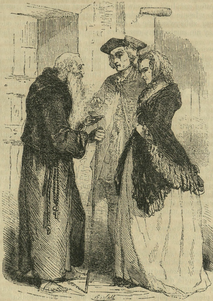
Zbliżył się wreszcie do nas i z uprzejmością podał mi swoją rogową tabakierkę, którą trzymał w ręku.

Pan Dessein powrócił, a otwierając zamknięte niedawno przez siebie drzwiczki oświadczył mojej damie, że hrabia L. jej brat, w tej chwili przybył do gospody. Jakkolwiek jej z całego serca wszystkiego dobrego życzyłem, wyznać jednak muszę, że z tego wypadku nie bardzo się ucieszył; nie mogłem też tego przenieść na siebie, abym jej tego nie dał poznać, mówiąc do niej z pewnym rodzajem ubolewania, że przypadek ten stał się