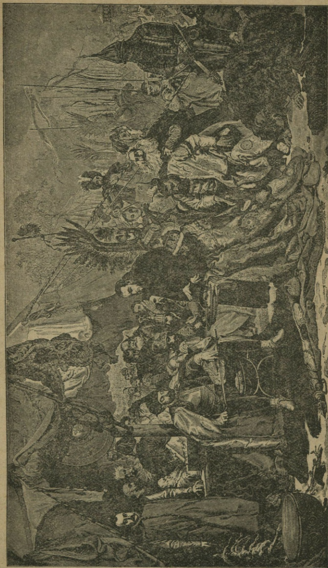
Stefan Batory przyjmuje posłów moskiewskich pod Pskowem. (Podług obrazu Jana Matejki).