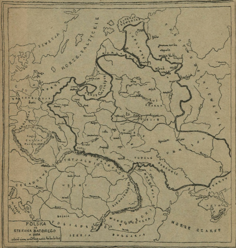
Polska przy końcu panowania Stefana Batorego.

chlubny dla nas rozjem w Kiwerowej Horce. Był on w znacznej mierze zasługą Zamojskiego, który okazał tu wielki rozum. Widział, co się z wojskiem dzieje, więc