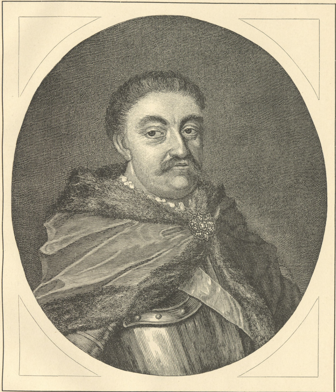
JAN III, KRÓL POLSKI.