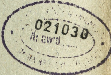
TABELA DESANTOWANIA DPD

ARCHIWUM BIBLIOTEKI SZKOLENIA AKADEMII SZTABU GENERALNEGO im. gen. broni K. Świerczewskiego 236296