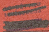
Fig. Nr 1