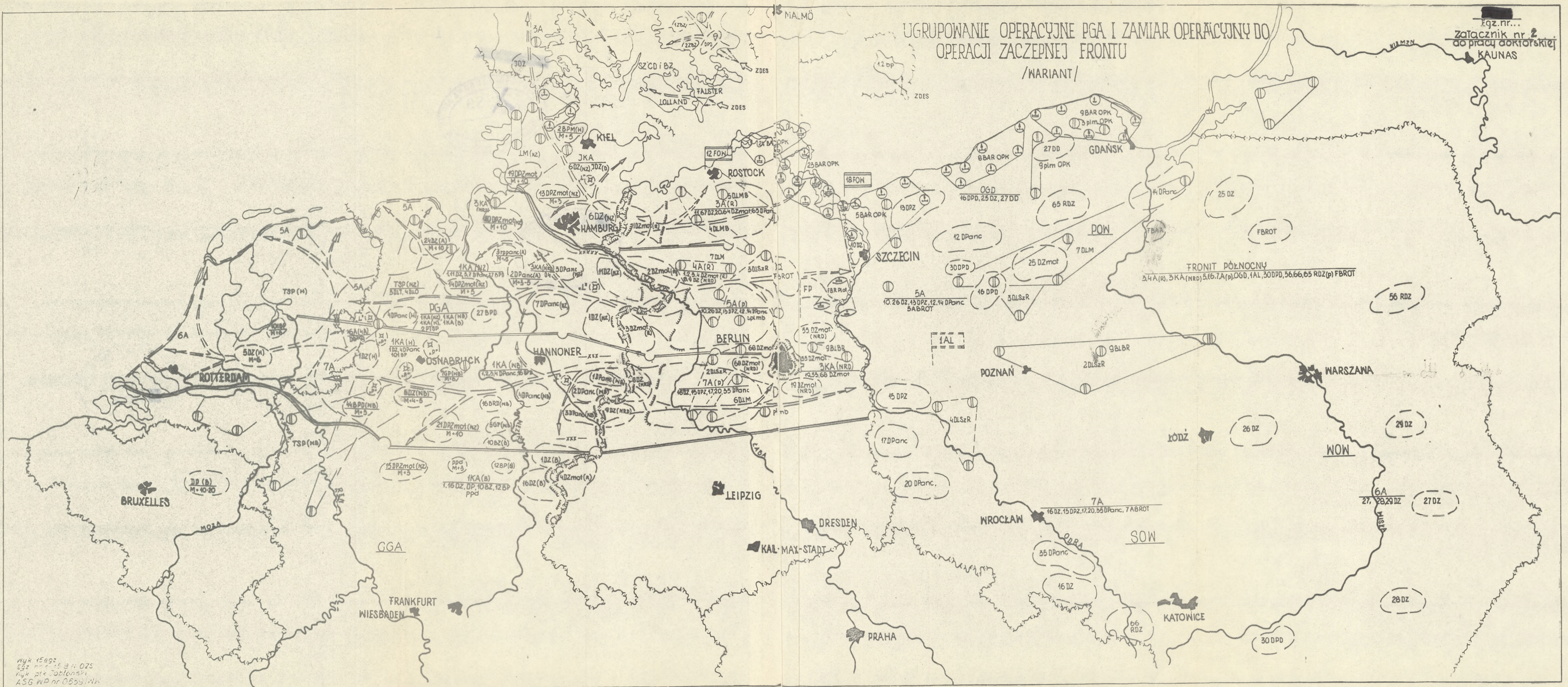
Fig. nr... załącznik nr 2 do pracy doktorskiej KAUNAS

FRONT PÓŁNOCNY 3,4A(R), 3KA(NRD), 5,6,7A(p), OGD, 1AL, 30DPD, 56,66,65 RDZ(p) FBROT