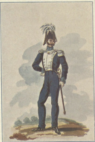
OFFICER (1833 — 1836).