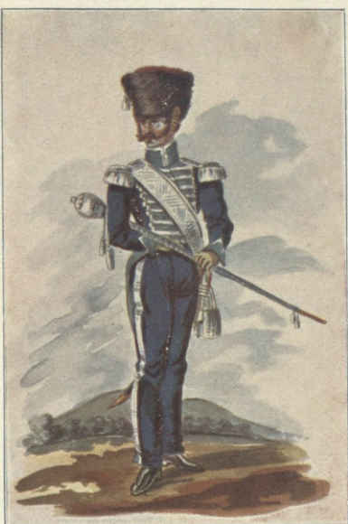
TAMBUR-MAJOR (1833 - 1836).