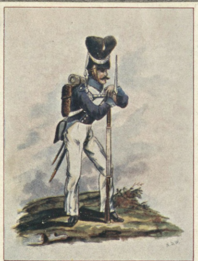
GRENADYER (1815 — 1833).