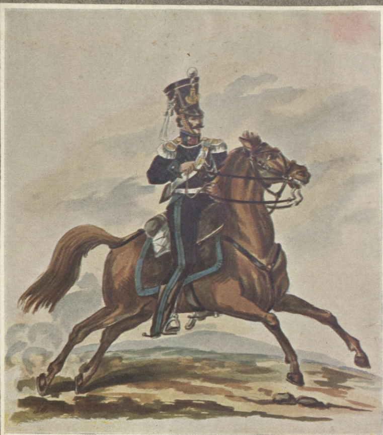
ŽANDARM KONNY (1833 — 1836).