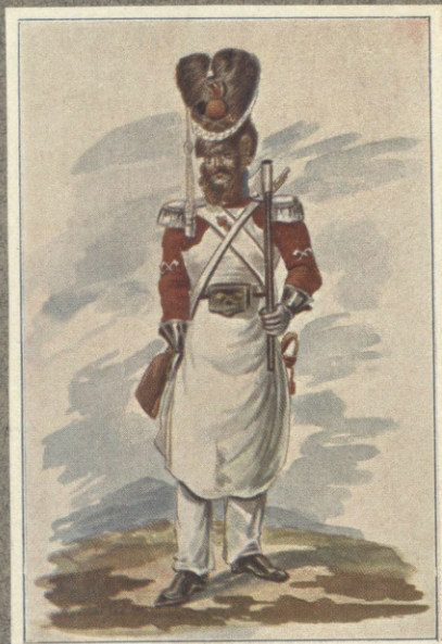
SAPER (1833 — 1836).