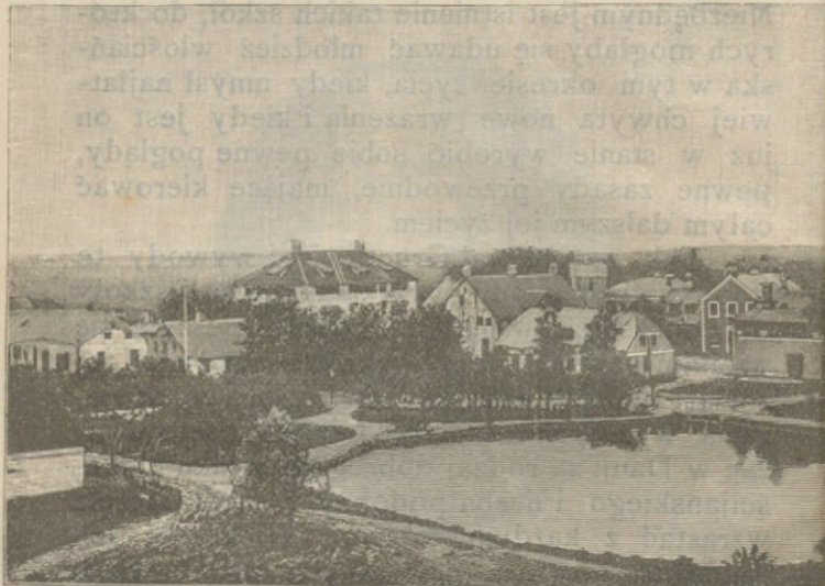
UNIwersytet ludowy w Askov (Danja).

Z samego początku nauczanie w wyższych szkołach ludowych miało cechę czysto religijną, a celem jego było przedewszystkim