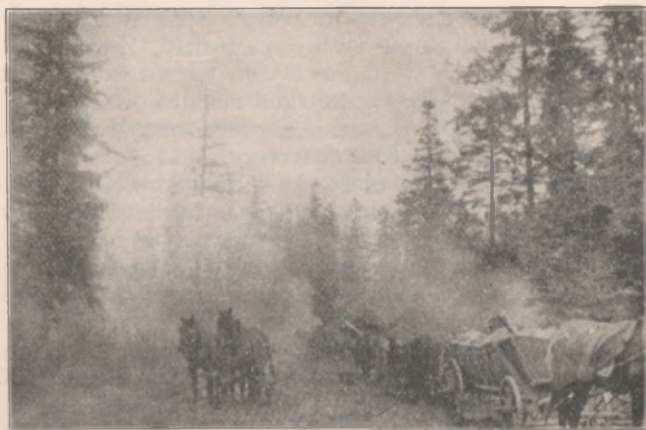
Furmanki w lesie.

i z pełnemi kieszeniami szedł do szeregowców, lub na „bibę“ do plutonu! Ileż razy w Kętach częstował nocne warty cukierkami i cygarami, skrzętnie przez siebie dla żołnierzy zbieranymi. Więc nie brak czu-