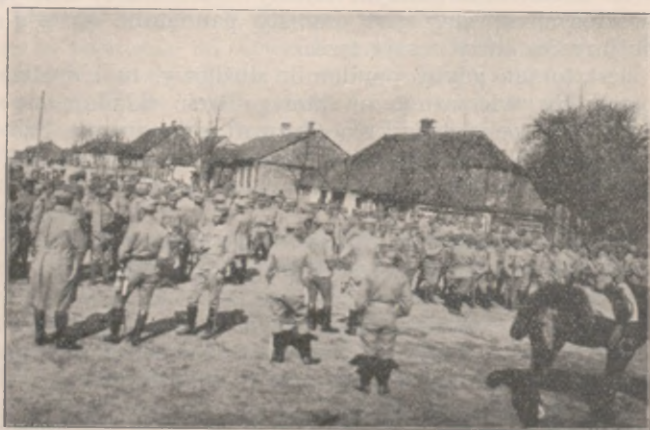
Przed główną kwaterą.

Porządek służby w okopach (z nad Nidy). Znaczenie musztry w wychowaniu żołnierza i w organizacji wojska. Raport z działalności i stanu kompanii 4-ej