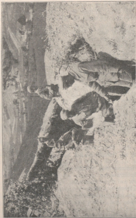
W rowach strzelniczych pod Konarami.