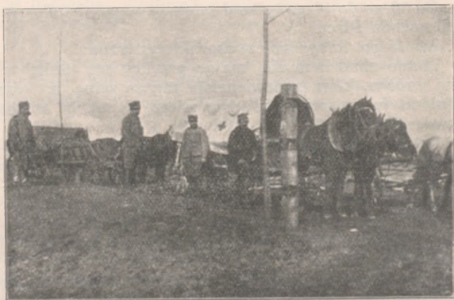
Furmanki z rannymi.

nił. Był on przygotowany na to wszystko już przed wojną, w czasie pokoju, tą surową i wzniosłą atmosferą żył zawczasu.