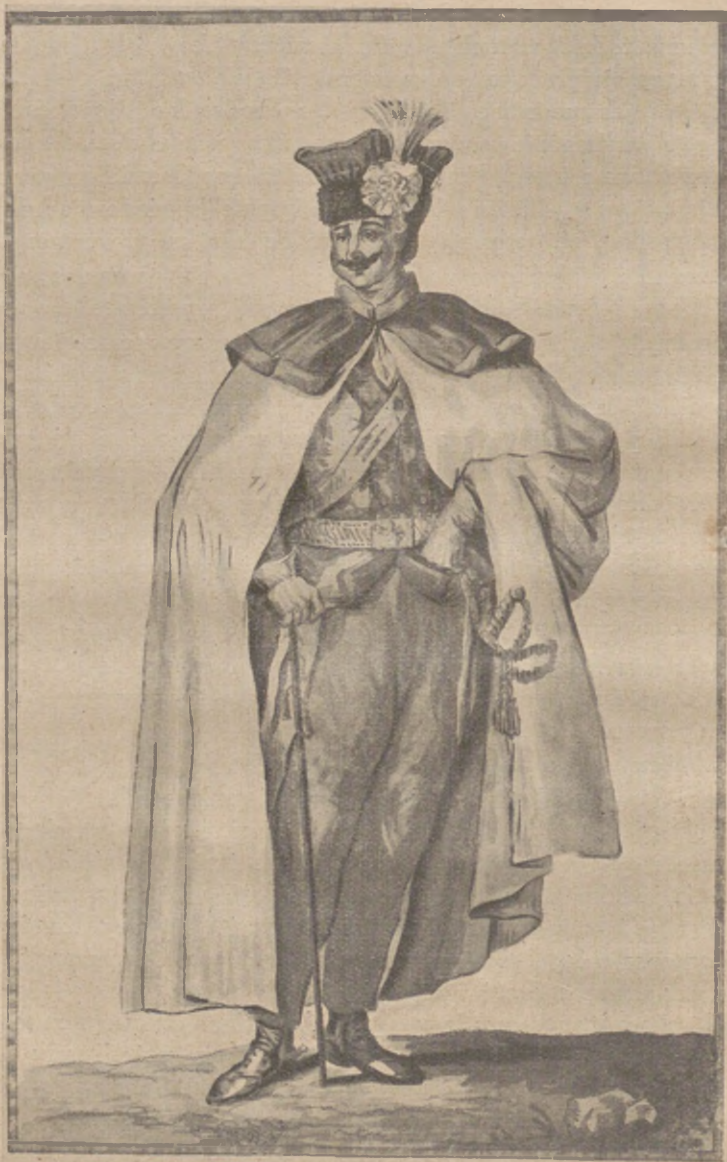
Tokarz w Narozu

rozrzucone szwadrony jazdy w miejscu postoju dowództwa brygady (74). Następnie poszczególne bataljony piechoty, rozrzucone na dość znacznych przestrzeniach, musiały przeprowadzić ze sobą korespondencję w sprawach, które dotyczyły gospodarki pułkowej. Okazywało