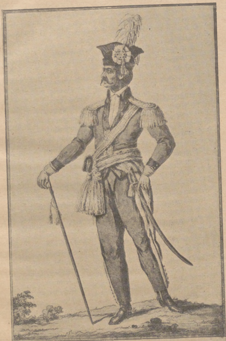
Rittmeister kawalerii Narodowej Brygady Wielkiej Polaków

dowej, a za czasów Sejmu Czteroletniego przewodniczył deputacji do ułożenia etatów. Wyniesienie swoje zawdzięczał jedynie te-