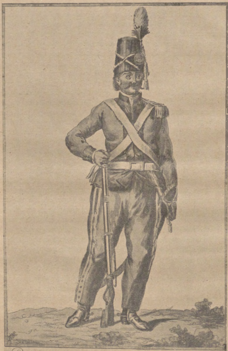
Porzucany kawalerji Narodowej Brygady Wielkiej