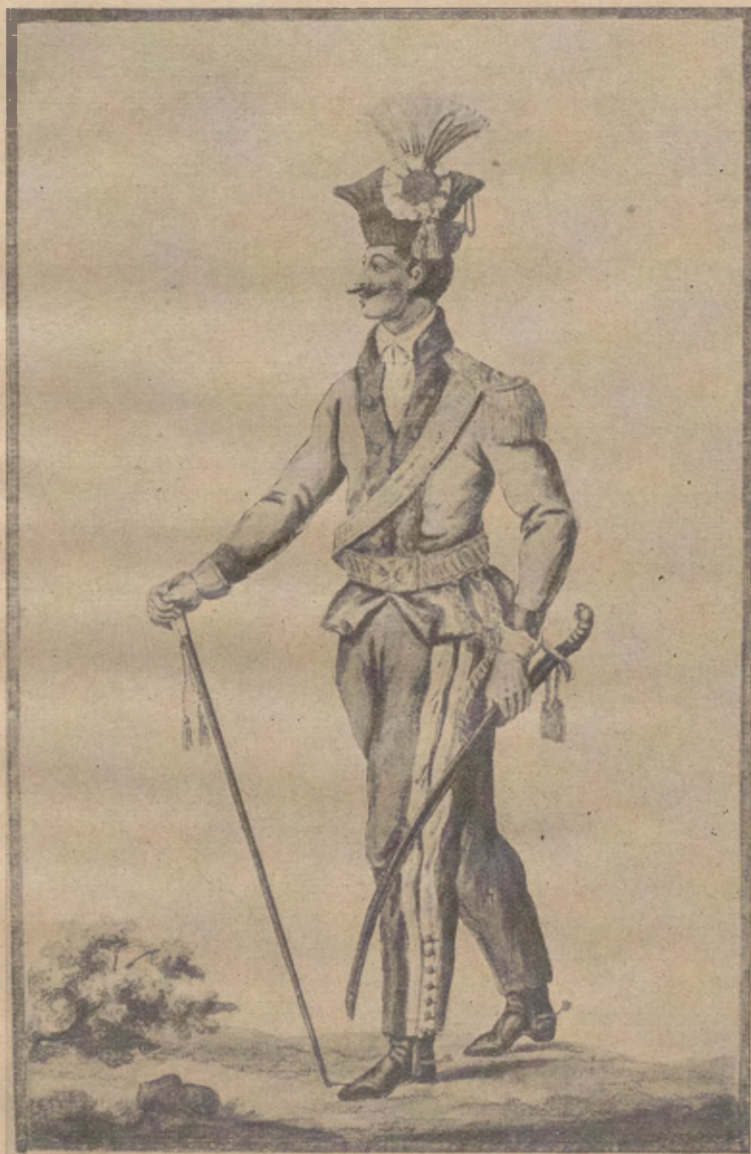
Towarzysz kawaleryi Mucedowskiej, Brygady Wielkiej Polki.

53— 7) towarzystwa—225; 8) podoficerów—80; 9) szeregowców—884; 10) trębaczy, felczerów, konowałów, siodlarzy — 46; 11) koni służbowych—1308; 12) wozów żywnościowych—13; 13) powózek pod namioty—12. (123) Całość wynosiła: 44 oficerów pełniących służbę, 279 na-