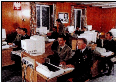
Zajęcia grupowe w sali komputerowej

Centrum Informatyki jest pozawydziałowym ośrodkiem edukacyjnym i naukowo-badawczym Akademii Obrony Narodowej.