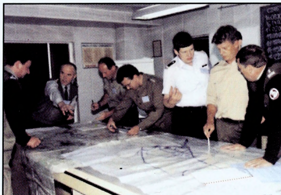
Grupa studentów podczas ćwiczeń dowódczo-sztabowych

Uczelnia dysponuje nowoczesną bazą dydaktyczną z ponad pięcioma tysiącami miejsc w aulach, salach do ćwiczeń, laboratoriach, salach komputerowych i gabinetach specjalistycznych oraz biblioteką ze zbiorami liczącymi około miliona woluminów.