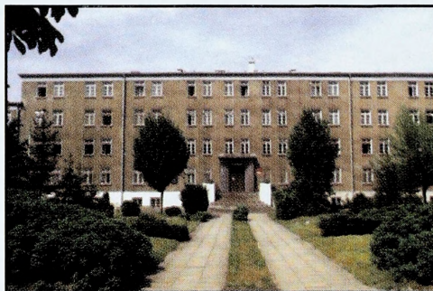
Siedziba Wydziału Strategiczno-Obronno- i Studium Języków Obcych (blok nr 25)

Wydział Strategiczno-Obronny jest ośrodkiem edukacyjnym i nauko-wo-badawczym prowadzącym działalność naukową i dydaktyczną z zakresu nauk wojskowych, zwłaszcza szeroko pojmowanego bezpieczeństwa państwa, strategii i ekonomiki obronnej oraz innych, związanych z nimi dyscyplin. Wydział przygotowuje wyższych dowódców i szefów komórek wojskowych oraz kadry cywilnej administracji rządowej i samorządowej z zakresu rozwiązywania problemów zewnętrznych i wewnętrznych, związanych z egzystencją państwa w okresie pokoju, kryzysu i wojny.