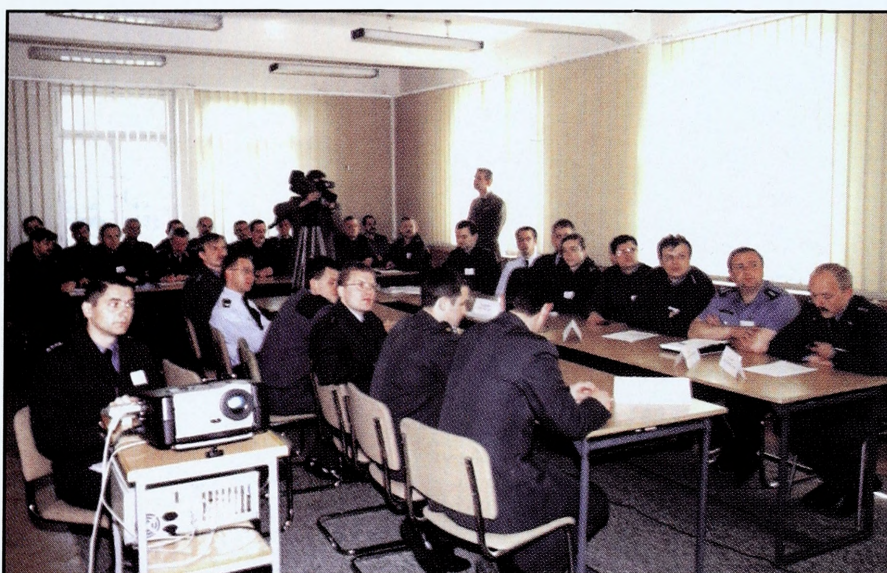
Praca studentów wydziału podczas międzynarodowego ćwiczenia dowódczo-sztabowego