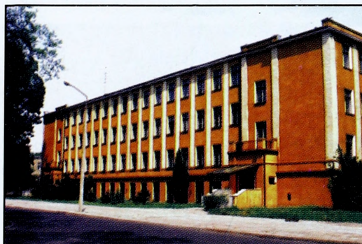
Siedziba Instytutu Nauk Humanistycznych (blok nr 94)

Instytut Nauk Humanistycznych jest ośrodkiem edukacyjnym i naukowo-badawczym współrealizującym programy kształcenia na wszystkich kierunkach studiów i kursach. Prowadzi badania naukowe w zakresie: filozofii bezpieczeństwa, socjologii wojska, etyki zawodu wojskowego, pedagogiki, psychologii dowodzenia i historii sztuki wojennej.