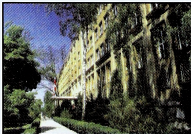
Siedziba Komendy AON i Wydziału Wojsk Lądowych (blok nr 101)

Wydział Wojsk Lądowych jest ośrodkiem edukacyjnym i naukowo-badawczym przygotowującym wysoko kwalifikowane kadry na stanowiska dowódcze i sztabowe w wojskach lądowych, zdolne do kierowania zespołami ludzkimi w warunkach pokoju, kryzysu i wojny oraz w misjach pokojowych. Przygotowuje także kadry dydaktyczne dla potrzeb szkolenictwa wojskowego.