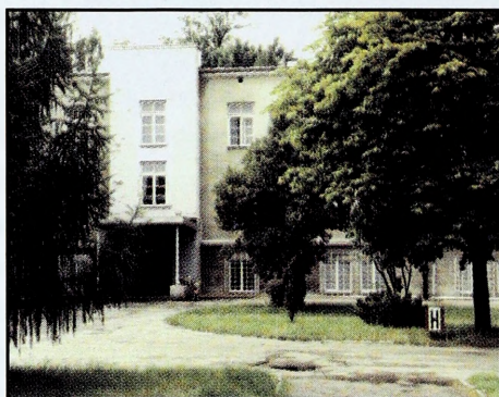
Siedziba Wydziału Wojsk Lotniczych i Obrony Powietrznej (blok nr 22)

Wydział Wojsk Lotniczych i Obrony Powietrznej jest ośrodkiem edukacyjnym i naukowo-badawczym przygotowującym wysoko kwalifikowane kadry na stanowiska dowódcze i sztabowe dla potrzeb sił powietrznych i innych rodzajów sił zbrojnych.