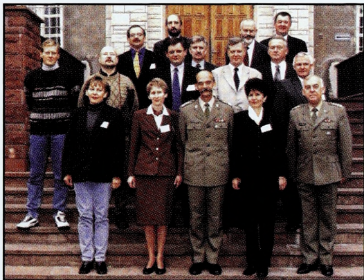
Grupa uczestników WKO po zakończeniu kursu

12. Wyższe Kursy Obronne – rozwijają wiedzę kadr cywilnych z zakresu obronności państwa i problematyki bezpieczeństwa narodowego. Na WKO są kierowane przez Kancelarię Prezesa Rady Ministrów osoby zajmujące kierownicze stanowiska w administracji rządowej i samorządowej, kierownicy instytucji i jednostek organizacyjnych. Na kurs zapraszani są przez ministra obrony narodowej posłowie i senatorowie RP.