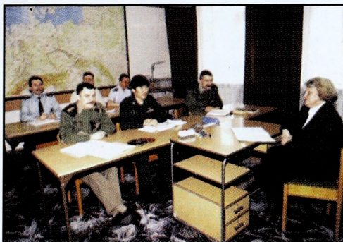
Zajęcia z języka polskiego dla obcokrajowców

Studium jest jednostką dydaktyczną realizującą programy kształcenia z zakresu języków obcych i języka polskiego zasadniczo na wszystkich kierunkach studiów.