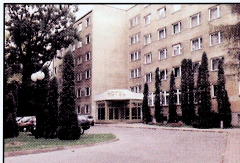
Hotel Akademii Obrony Narodowej

Akademia zapewnia również swoim studentom pełny asortyment usług socjalnych , dysponuje siecią internatów, bufetów oraz restauracją, hotelem, kawiarnią i kinem.