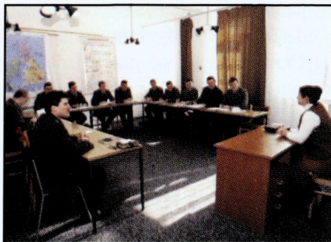
Zajęcia z języka angielskiego w sali wykładowej