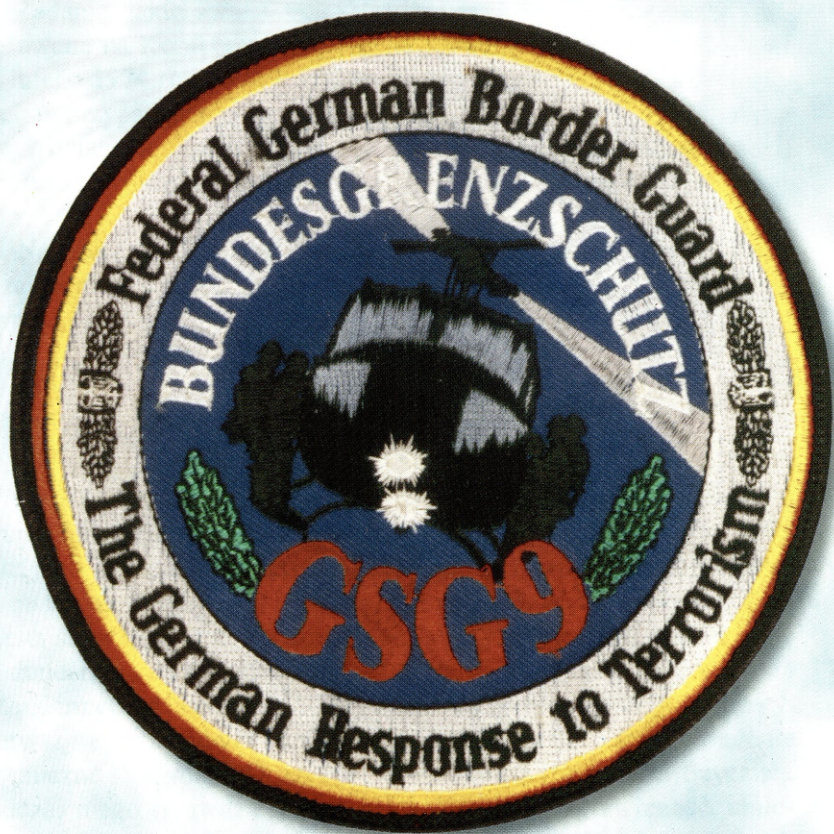
Ryc. 2. Logo jednostki GSG-9