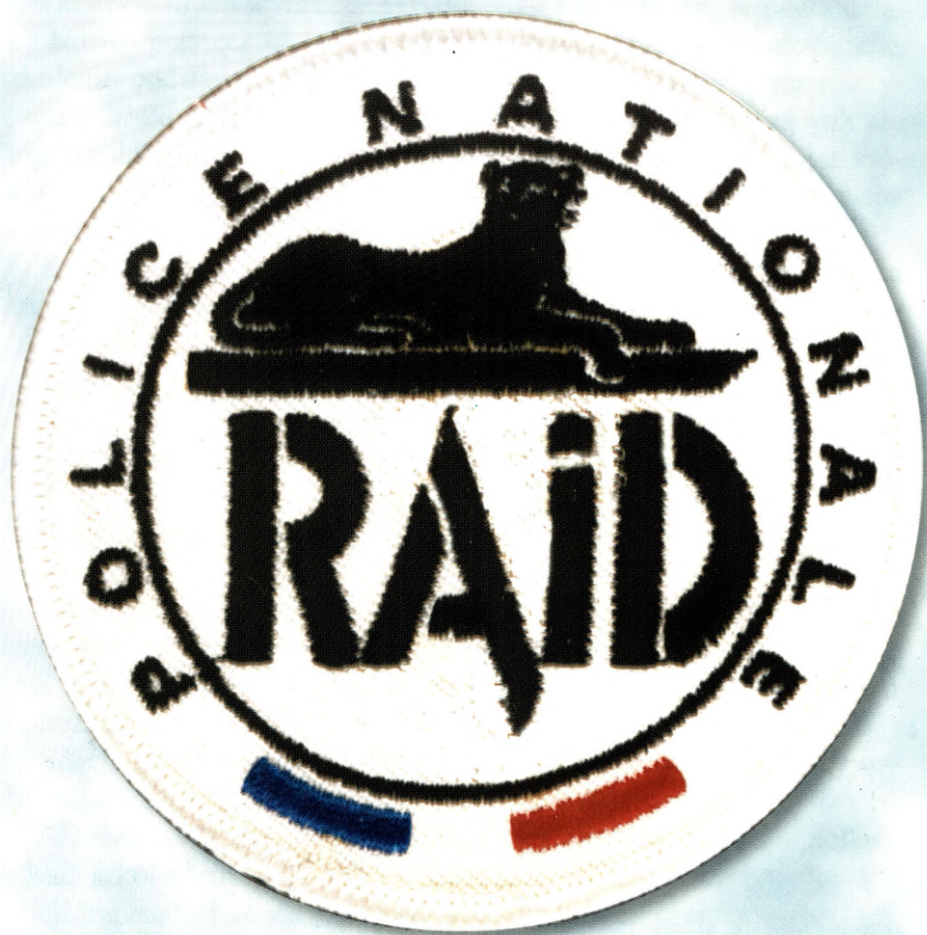
Ryc. 3. Logo pododdziału RAID