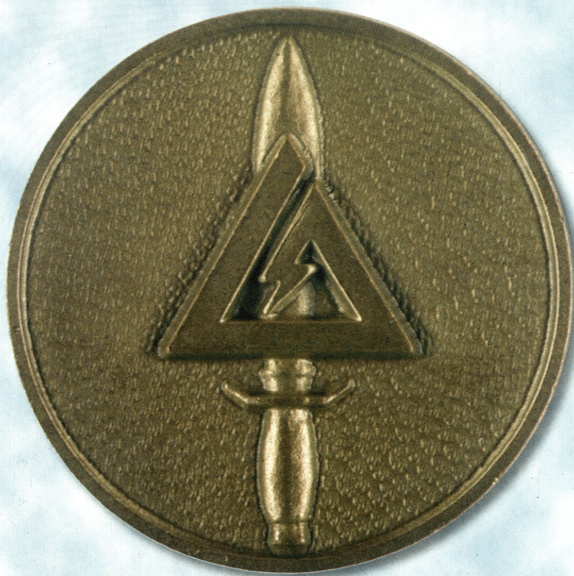
Ryc. 4. Logo Delta Force