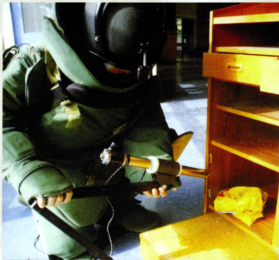
Ryc. 6. Ubranie antyodłamkowe EOD-7