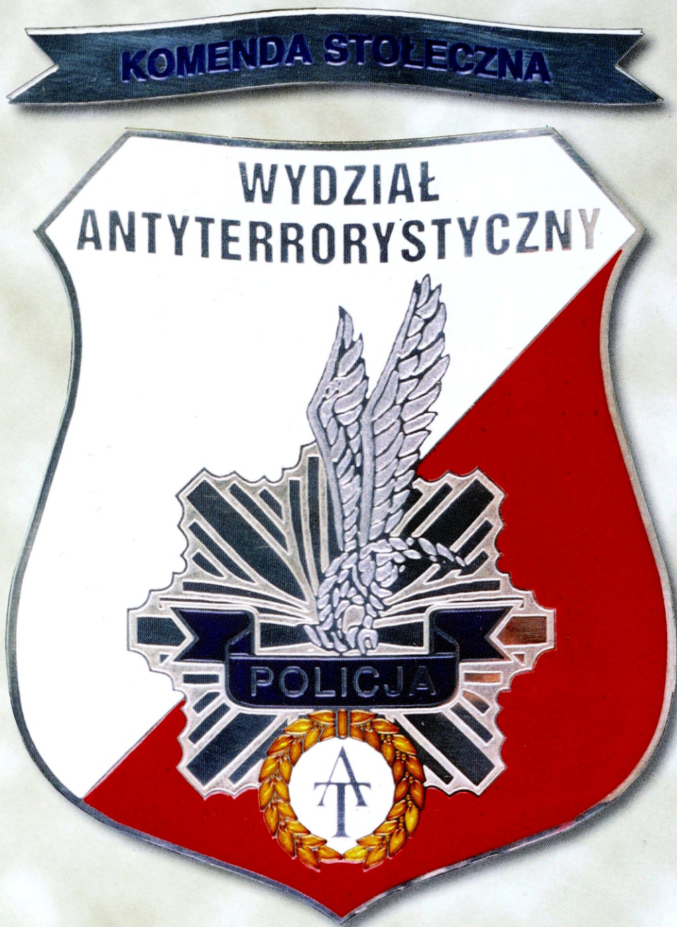
Ryc. 1. Logo Wydziału Antyterrorystycznego KSP