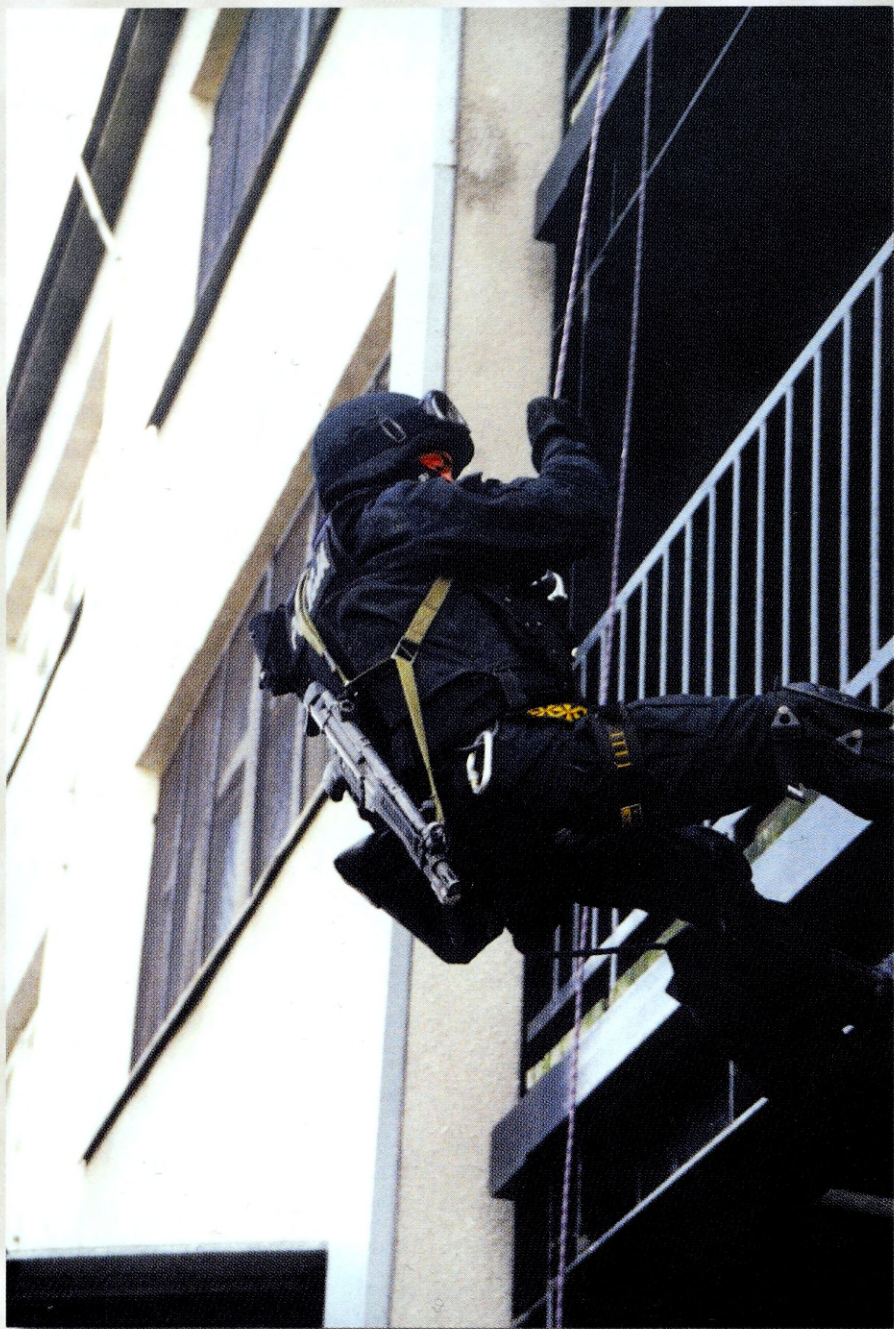
Ryc. 3. Szkolenie - alpinizm miejski