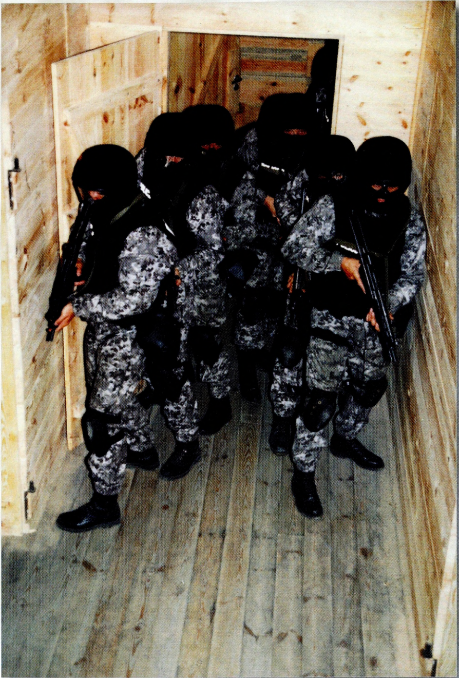
Ryc. 2. Szkolenie taktyczne pododdziału antyterrorystycznego