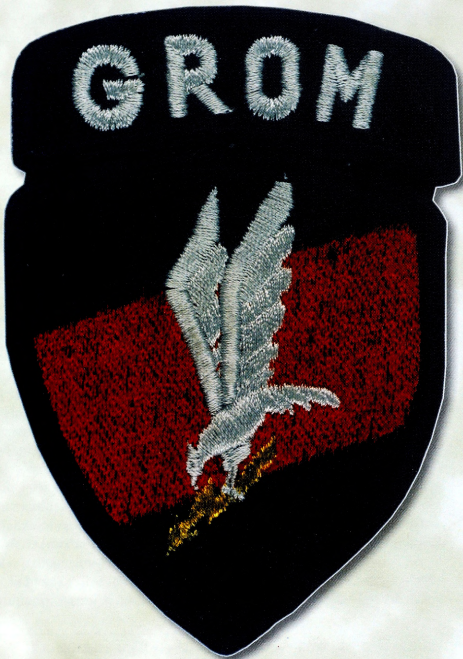
Ryc. 7. Logo jednostki GROM