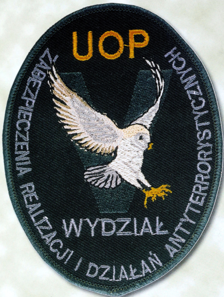
Ryc. 8. Logo Wydziału V Zarządu Śledczego UOP